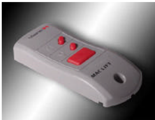
veggkontroll (standard 8700)