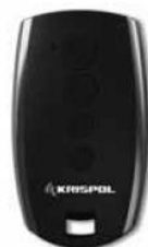
4-channel transmitter KRISPOL NAD.KK.002