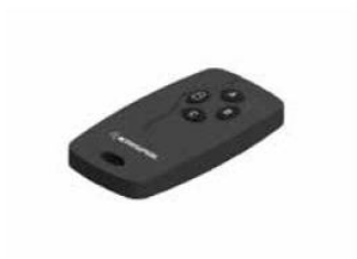
3-channel transmitter KRISPOL NAD.KK.001